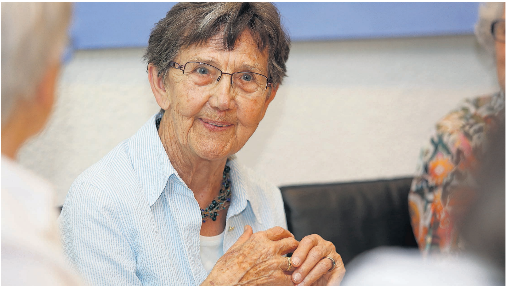
Seniorinnen und Senioren sprechen im Egghölzli über existenzielle Fragen. Alle lachen, als jemand sagt: «Ich habe keine Angst vor dem Tod, aber beim Sterben möchte ich nicht dabei sein».