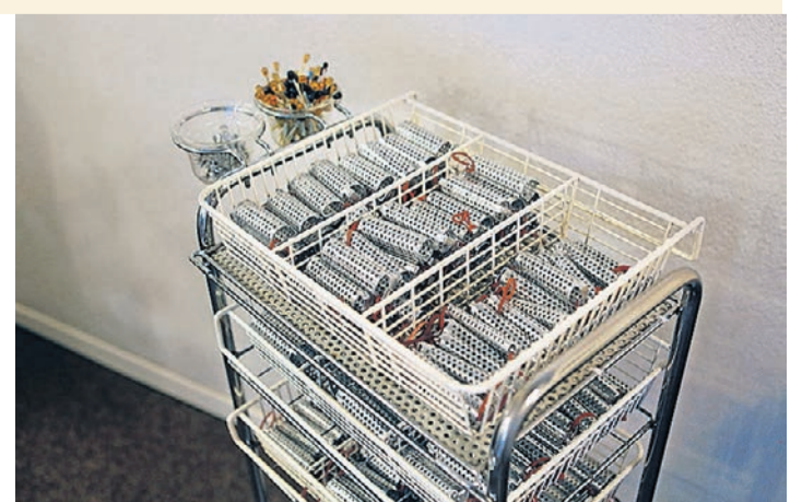
Bunter Alltag in der Altersresidenz: Manchmal hilft ein Kirchenlied (Bild links) oder ein Coiffeurbesuch. Die 77-jährige Astrid Schäfer arbeitet seit 36 Jahren im Egghölzli.