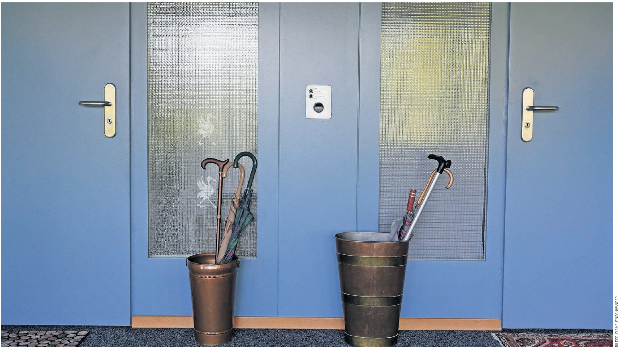
Viele Lebensentwürfe, viele Altersbresten. Aber erstaunlich wenig Probleme wegen unterschiedlicher Weltanschauungen.