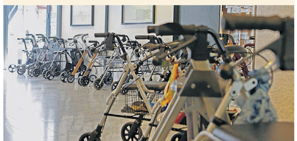
Ansturm auf das Mittagessen: Rollator-«Parkplatz» vor dem Restaurant.

Aus dem Bücherregal holt sie ein Album, zeigt Bilder von Reisen nach Kanada, Schottland, erzählt von unbeschweren Tagen mit ihrem Mann. Und von diesem erstaunlichen Phänomen: Dreimal hat sie seit dem Tod ihres Mannes draussen plötzlich ein Herz entdeckt: in einem Schattenspiel auf seinem Grab, in einem Blätterdach, im Wellenspiel der Aare. «Das war für mich ein Zeichen, dass es ihm gut geht, dort wo er jetzt ist», seufzt sie erleichtert. Auf dem Segelboot wird sie oft an ihn denken.