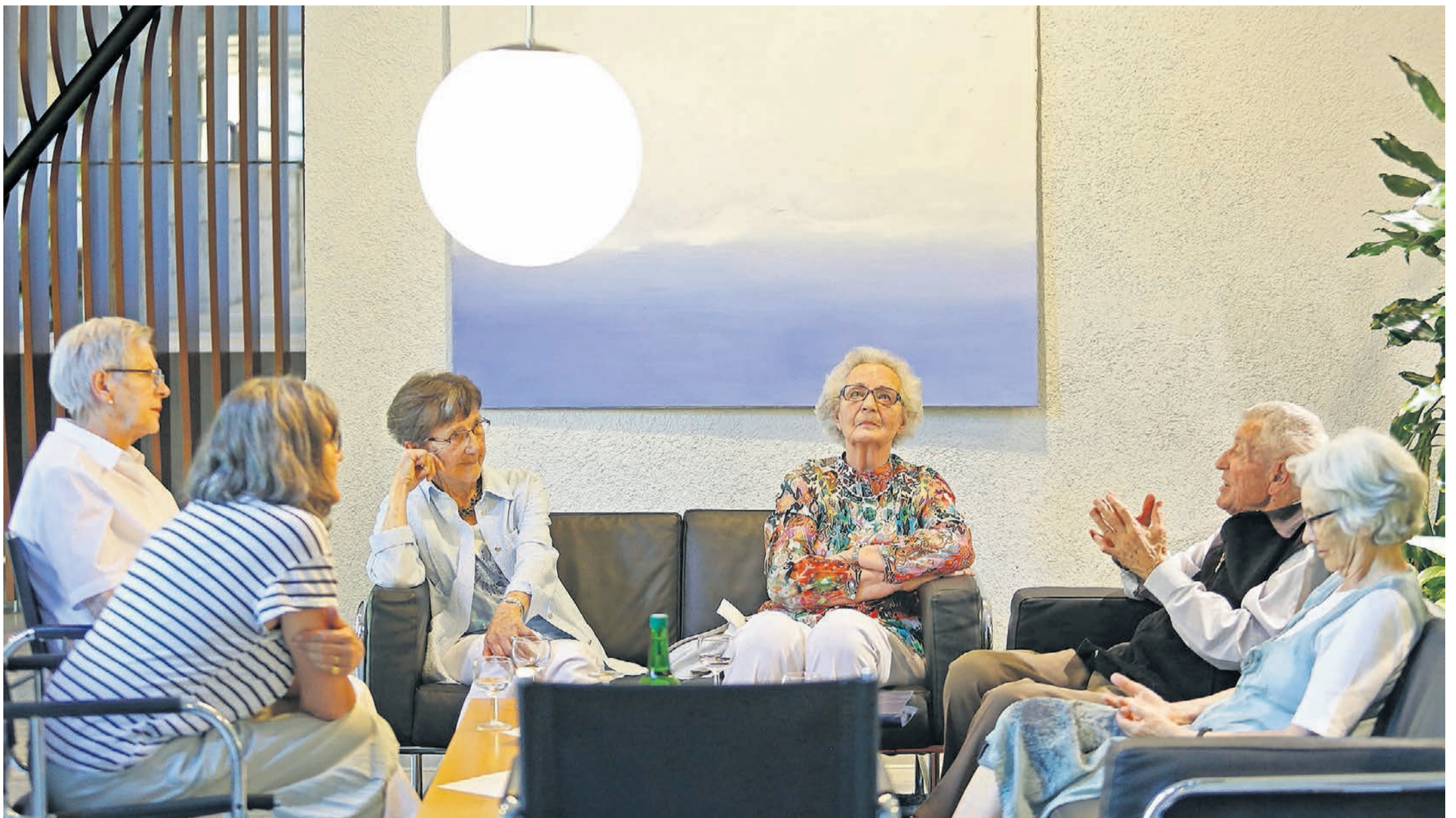
Plaudern über Gott und die Welt. Und – ganz selbstverständlich – übers Sterben. Man wäre bereit, aber «pressieren tuts nicht» ...