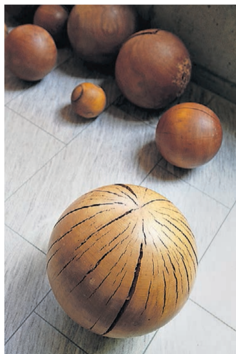
Kunst im Egghölzli. Seniorinnen und Senioren freuen sich über ein Gespräch mit der Seelsorgerin.

Spiritual Care ist in aller Munde, sie ist religionsungebunden. Könnte sie nicht die Seelsorge der Zukunft sein, in einer säkularisierten und zugleich multireligiösen Gesellschaft?